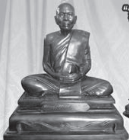
รูปเหมือน หลวงปู่ศรีจันทร์ วัณณาโก "รุ่นพิเศษ ปี ๒๕๕๗" ขนาด ๙ นิ้ว