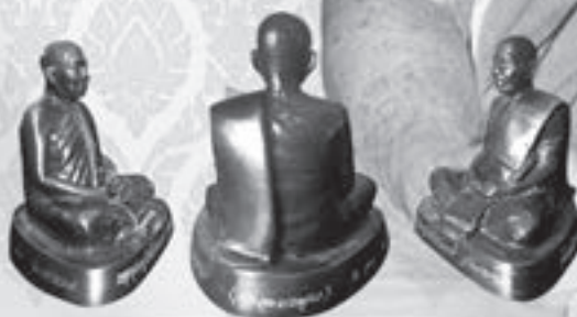
บูชา องค์ละ ๑,๙๙๙ บาท