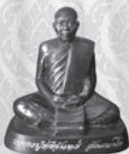
รูปเหมือน หลวงปู่ศรีจันทร์ วัณณาโก "รุ่นพิเศษ ปี ๒๕๕๗" ขนาด ๓ นิ้ว