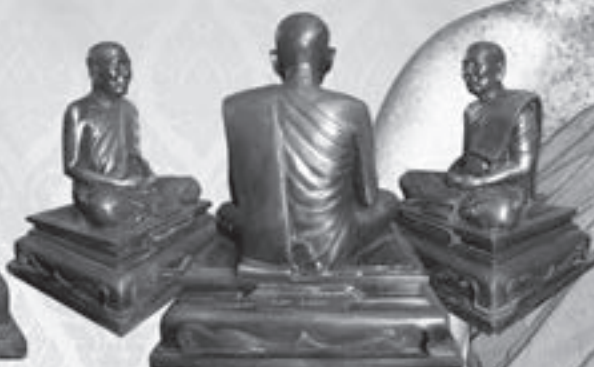
บูชา องค์ละ ๕,๙๙๙ บาท