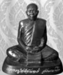
รูปเหมือน หลวงปู่ศรีจันทร์ วัณณาโก "รุ่นพิเศษ ปี ๒๕๕๗" ขนาด ๓ นิ้ว