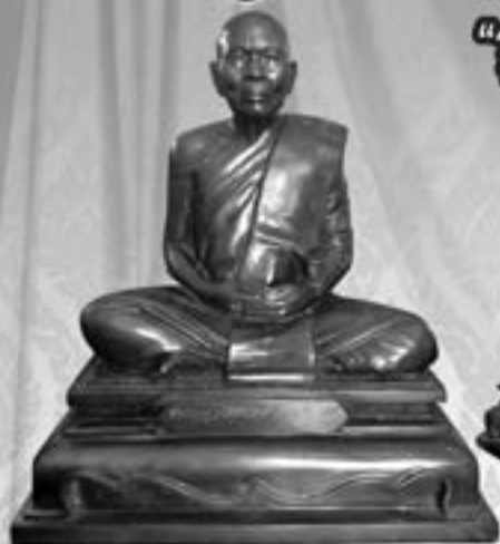
รูปเหมือน หลวงปู่ศรีจันทร์ วัณณาโก "รุ่นพิเศษ ปี ๒๕๕๗" ขนาด ๙ นิ้ว