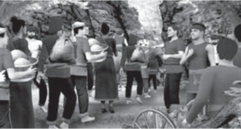
ปราชญ์ท่านกล่าวไว้ว่า