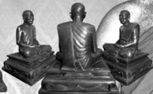
บูชา องค์ละ ๕,๙๙๙ บาท