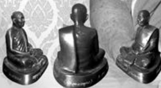
บูชา องค์ละ ๑,๙๙๙ บาท